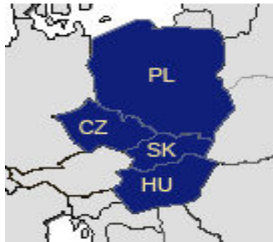
1. ábra: A Visegrádi Csoport 156