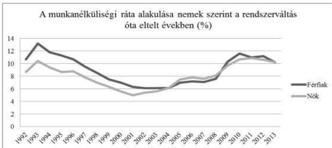
1. ábra: A munkanélküliségi ráta alakulása nemek szerint a rendszerváltás óta eltelt években (%)

Magyarországon a munkanélküliség a 90-es években kezdett megjelenni, és jelenleg meghaladja a 8%-os mértéket (1. sz. ábra). A rendszerváltás idején lezajlott gazdasági átalakulás szükségszerűen maga után vonta a társadalom átalakulását is. Új társadalmi csoportok jelentek meg, mint például a munkanélküliek és hajléktalanok. A kezdeti néhány tízezres nyilvántartott munkanélküliség 700 ezer körüli (1993. február) nagyságrendjével európai csúcst ért el. 1990-ben a munkanélküliségi ráta 2,7%-os aránya európai viszonylatban alacsonynak számított, a megyék között azonban már akkor is jelentős eltérések mutatkoztak. Az átlaghoz viszonyítva kiugróan magas arányt mutattak ki Szabolcs-Szatmár-Bereg (5%), Borsod-Abaúj-Zemplén (3,5%) és Hajdú-Bihar megyében (3,3%). Ezzel szemben a nyugat-dunántúli térségben – Győr-Moson-Sopron, Zala és Vas megyékben – 2% alatt maradt a munkanélküliségi ráta. Az Észak-alföldi régió – amely Hajdú-Bihar, Jász-Nagykun-Szolnok és Szabolcs-Szatmár-Bereg megyét foglalja magában - munkanélküliségi rátája 2010-ben átlagosan 14,5 % volt. Ez a mutató Szabolcs-Szatmár-Bereg megyében, kimagaslóan magas, elérte a 18,4 %-ot (Mohácsi, 2013).