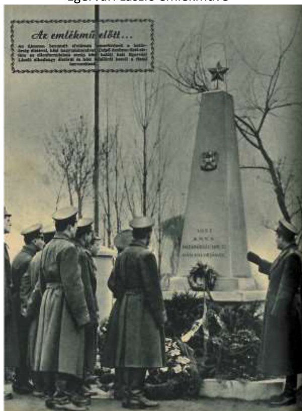
Egervári László emlékműve 606