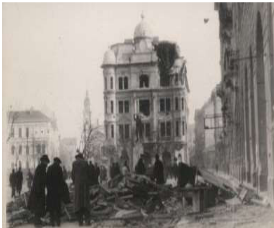
Harminckettesek tere 1956. október-november