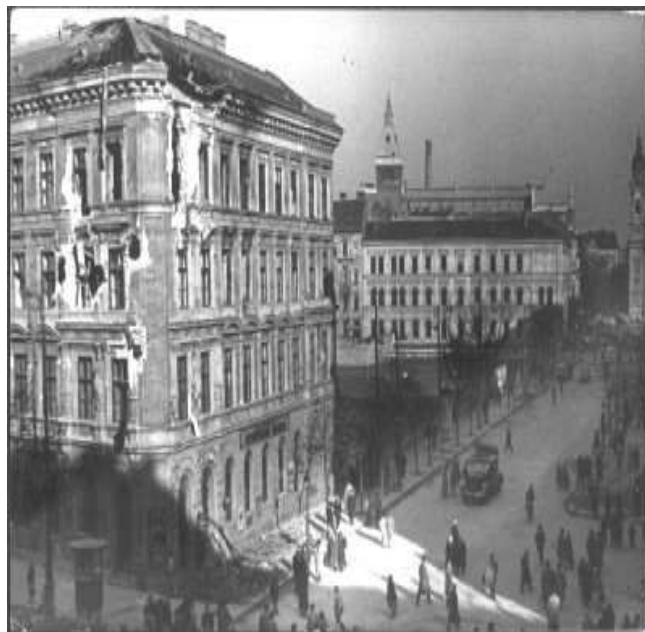
Hárminckétesek tere Körút sarka 1956. október-november