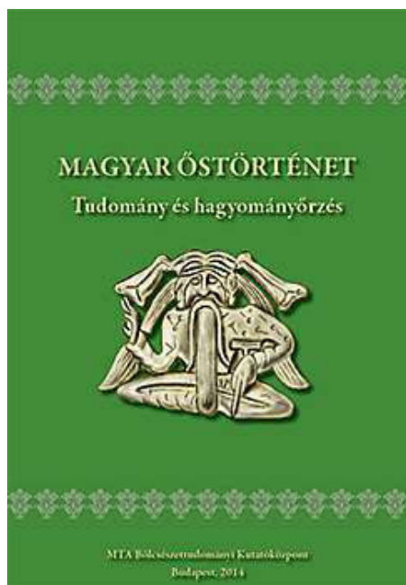
Könyv a Magyar Őstörténet Konferencia előadásairól (MTA, 2013. ápr. 17-18.)