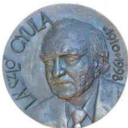
László Gyula régész emléklakettje (az Őstörténetünk szerzője)

Magyarországon jelenleg nincs külön írástörténeti képzés – mégis egyes „hivatásos” történészek, régészek, íráskutatók szinte érvelés nélkül „amatőrnek” bélyegeznek másokat – majd erre a szubjektív ítéletre hivatkozva az utóbbiak eredményeit teljesen figyelmen kívül hagyják!