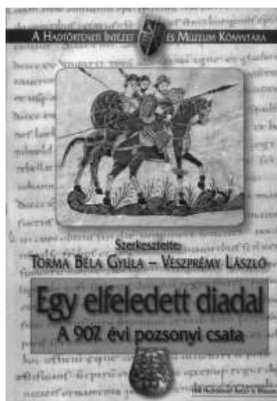
A 2008-ban megjelent könyv a Pozsonyi csata részletes leírását tartalmazza