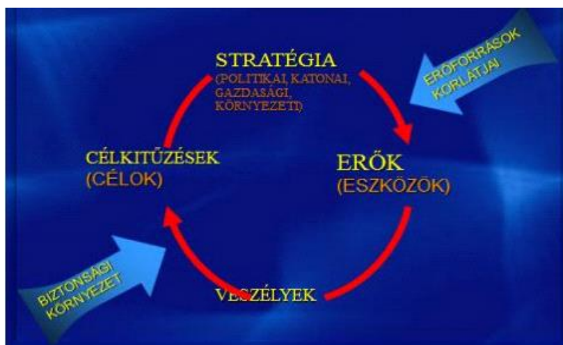
3. Ábra: Bartlett modell (forrás: Stratégiaalkotás, stratégiai módszerek 23.o.) [5]

Ez a modell egyszerűbbnek tűnik, mint az általános modell és kevesebb lépést tartalmaz, azonban a lényege ugyanaz, az erőforrások és a veszélyek összevetéséből határozza meg a biztonsági célkitűzéseket, amelyeket a stratégia által tervez megvalósítani.