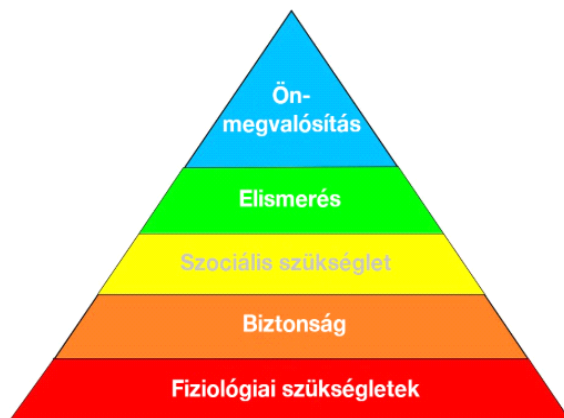
1. Ábra: Maslow piramis

A Maslow-piramist 5-lépcsősként jellemezzük, amely így néz ki: